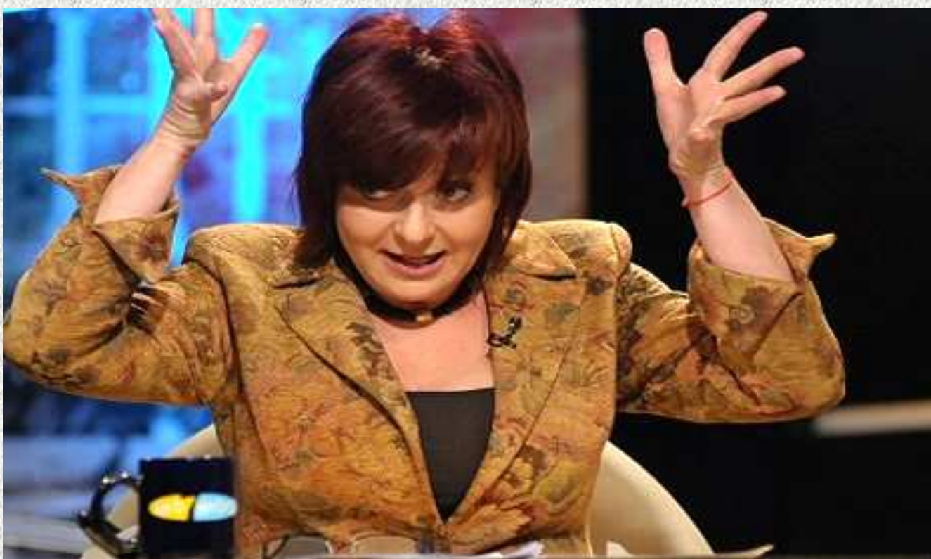
Hernádi Judit a C

A piros fonalat egy átoküző szertartás keretében kapta a színésznő, mely nemcsak átok és rontás ellen véd, de akkor is, ha valakinek párkapcsolat át átkozta meg valaki. Gyakran ugyanis a harmadik fél azt akarja, hogy egy kapcsolat romoljon meg. Hernádi Judit életre szóló védelmet kapott - írja az Új ász .